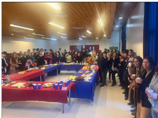
Celebración Día de la Madre