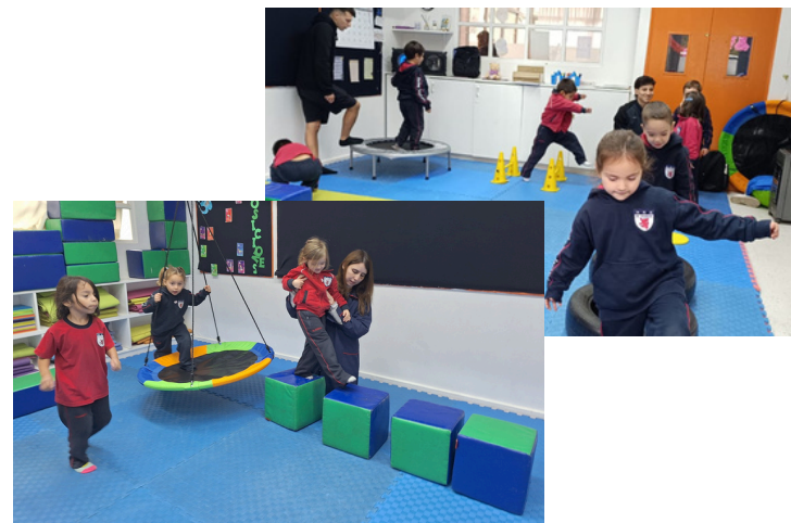
Nueva sala de psicomotricidad en la cual los niños son apoyados por un equipo especial