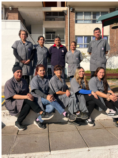
Queremos destacar el importante y noble trabajo que desempeñan nuestro equipo de auxiliares